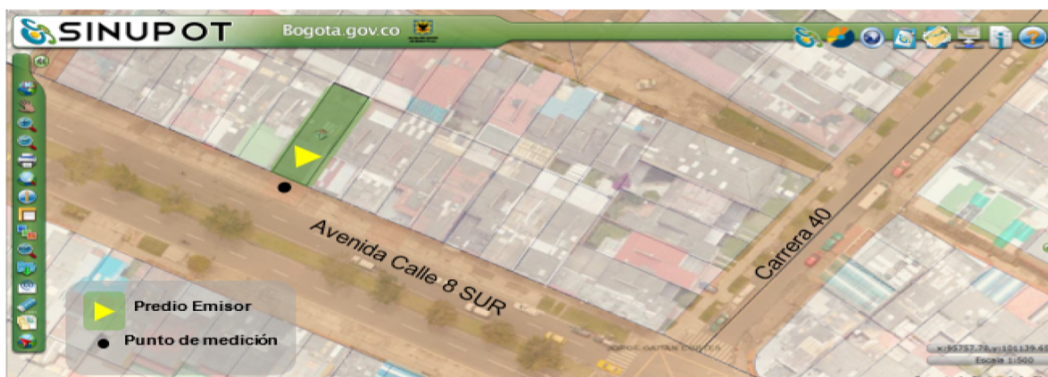
Figura No. 1. Ubicación del predio emisor y punto de medición.

Nota 4: Datos suministrados en el Anexo No 6. Reporte Uso de Suelo.